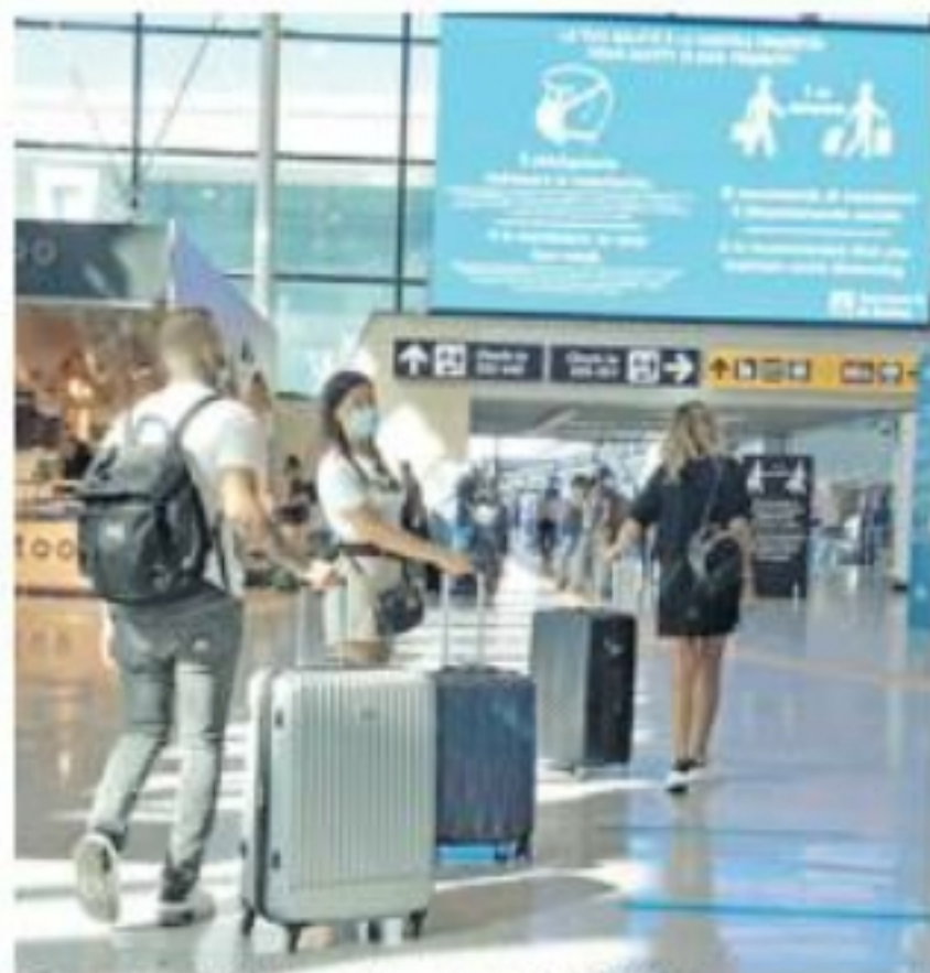
L'economia sarda fortemente legata alla salute del turismo

La Sardegna deve sfruttare le chance della nuova programmazione Ue e del Recovery Plan, ma le criticità sono tante